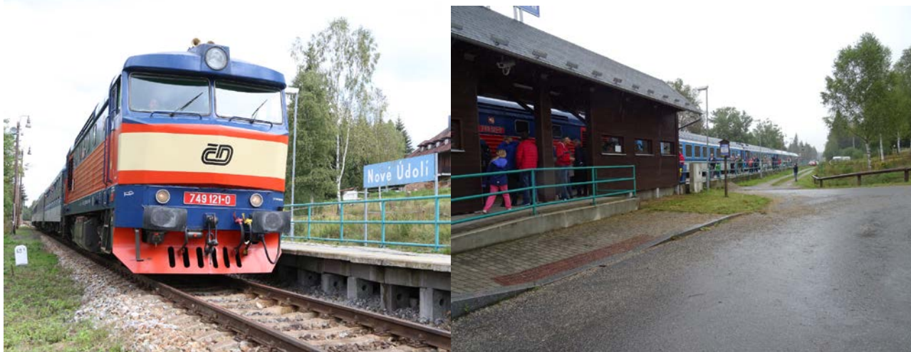
Ex 28531 Praha – Nové Údolí 7.9.2019

Zpracoval: Pavel Kosmata, +420 602 123 108